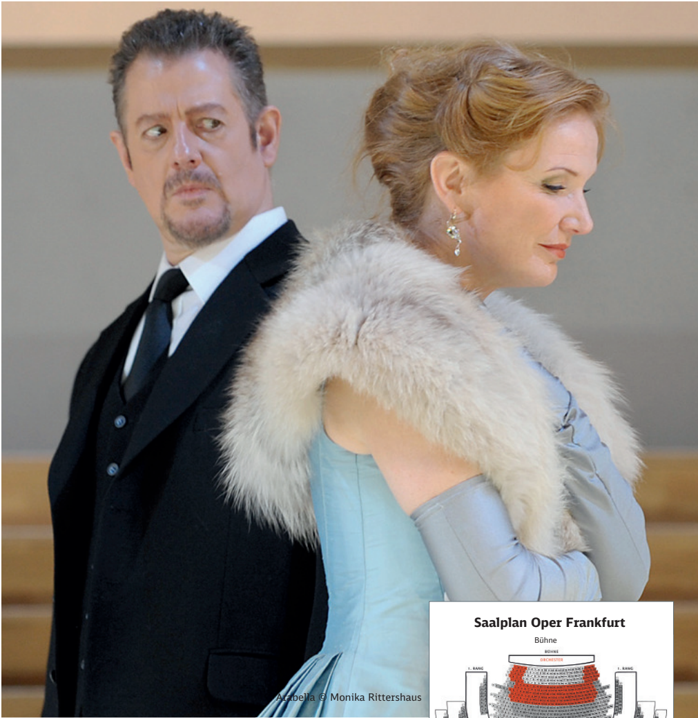
Arabella © Monika Rittershaus